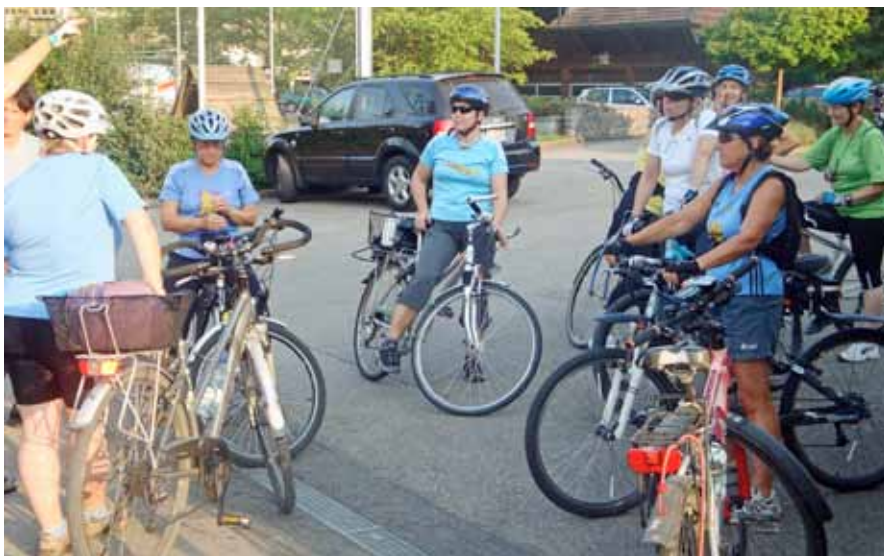
Einmal im Jahr satteln wir unsre Drahtesel! Im hügeligen Emmental heisst das oft: Muskelaufbau für die Beine und Konditionstraining für den Kreislauf.