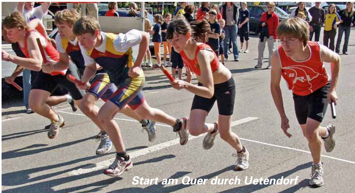
Start am Quer durch Uetendorf

Quer durch Solothurn Quer durch Wohlen und Quer durch Twann