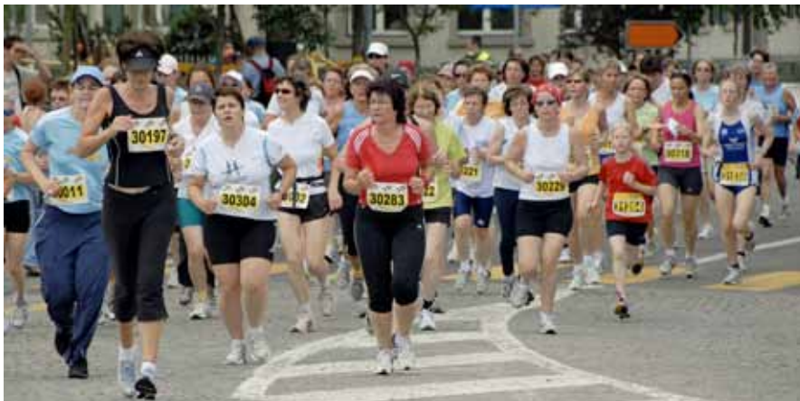
Jedes Jahr starten einige Frauen in verschiedenen Gruppen z. B. am GP von Bern, Frauenlauf und am Solothurner Walkevent.